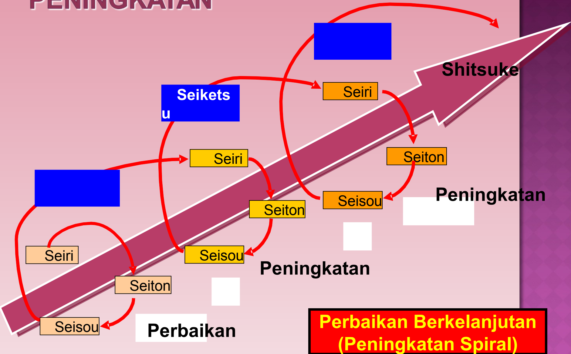
DIAGRAM RELASI PERBAIKAN & PENINGKATAN